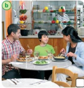
Saturdays / Sundays