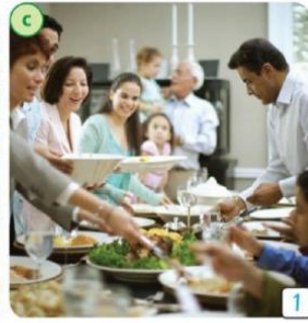
chicken / salad

Please listen to track number 10 and write what you hear for pictures “a and b” in your notebook.