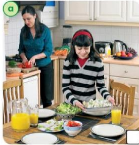
dinner / lunch